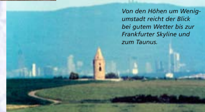
Von den Höhen um Wenigumstadt reicht der Blick bei gutem Wetter bis zur Frankfurter Skyline und zum Taunus.

The first part of the Geopark-Cultural Pathway (6 km long) will lead you through the agricultural landscape to the church and town hall. Having crossed the village centre, the path will lead you uphill through the Gottfriedswald to a lookout. The final station is the 14 Nothelferchapel. Please follow the yellow-on-blue EU boatlet marker.