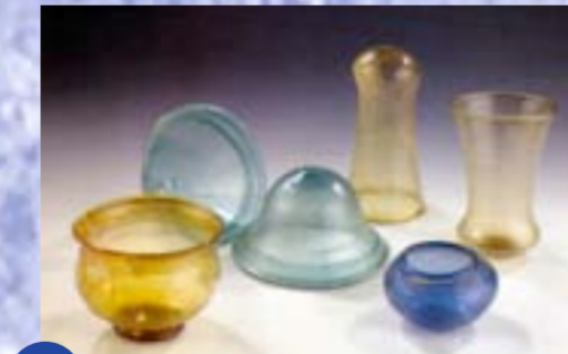
Bei Grabungen im Ortsbereich von Wenigumstadt trat frühmittelalterliches Glas zutage.