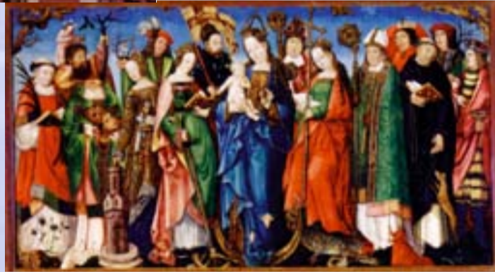
Das Tafelbild der Vierzehn-Nothelfer (15. Jahrhundert) stammt vermutlich aus fränkischer Schule.