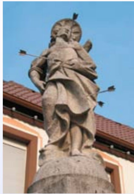
Der heilige Sebastian ist auf dem Brunnen neben dem Rathaus dargestellt.

Das Wenigumstädter Rathaus wurde 1584 erbaut.